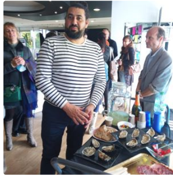
Un décrochage d'exposition photographique très réussi et convivial