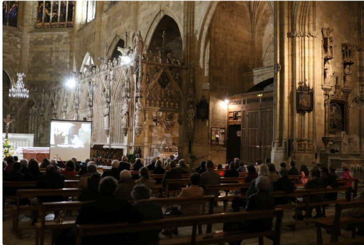
Une retransmission en vidéo mais en direct : qu'en pensent les spectateurs ?

De toute façon, le choix de l'orgue associé à la trompette, une garantie de succès pour un concert