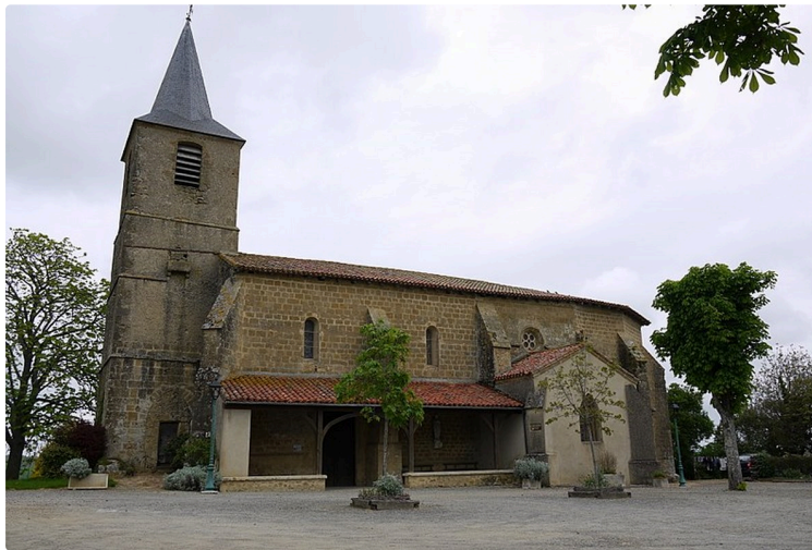
Lous Quarantapes à Labejan

C'est une ballade facile d'environ 6 km et d'une durée de 1 h 30 à 2 h.