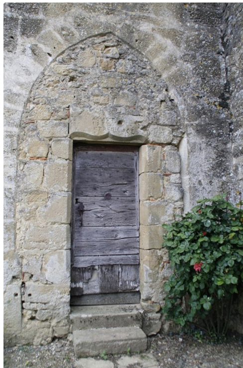
Labejan (1) [1280x768].JPG