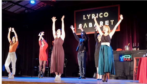
Lyrice Cabaret : fantaisie et virtuosité avec Chants de Garonne dimanche !

Quel bonheur de renouer avec les spectacles vivants !