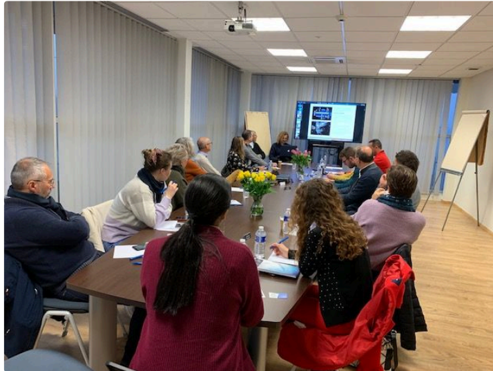
Une belle première" Matinale digitale" de la Manufacture

Jeudi 28 octobre a eu lieu la première" Matinale digitale" de la Manufacture. Elle s'est déroulée de 8h à 10h à Lectoure. La salle affichait complet. A 7H15, un petit déjeuner a été offert. Les ateliers ont débuté à 8h15. Ensuite, les personnes présentes ont pu poser des questions et obtenir des réponses sur les thématiques abordées.