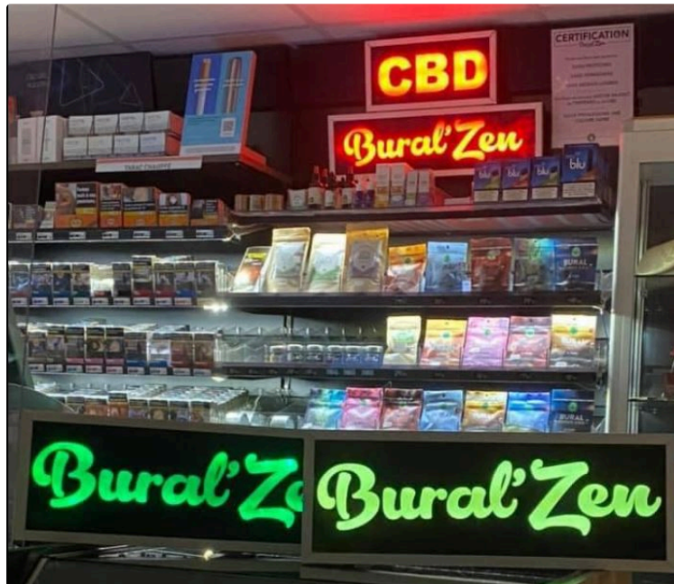
Le chanvre, une plante étonnante avec un effet bien-être apaisant !

Le CBD est disponible dans les bureaux de tabac comme à Valence-sur-Baïse