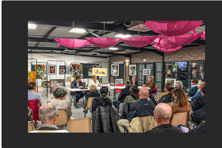
Don du sang Nogaro Aignan, une association dynamique

L'association Don du sang Nogaro Aignan (DSNA) tient son assemblée générale jeudi 21 octobre à la salle d'animation de Nogaro, qui est déjà presque totalement vidée du mobilier installé pour le centre de vaccination. Mais il y a encore les tableaux, les photos et les parapluies roses dans la petite salle où l'assemblée est réunie. On sait que la dernière séance de vaccination dans cette salle a eu lieu mercredi 20 octobre 2021.