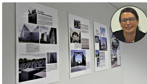
vue sur l'exposition, en médaillon Sandrine Redolfi De Zan