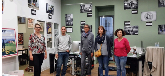
"Un métier passion, assistante maternelle", une très belle exposition photographique à voir à l'Office de Tourisme

Mardi dernier, avait lieu à dans les locaux de l'Office de Tourisme d'Artagnan en Fezensac, le vernissage de l'exposition photographique « Un métier passion, assistante maternelle » réalisée à l'occasion des 20 ans du Relais d'assistantes maternelles « Cabriole » devenu récemment le Relais Petite Enfance.