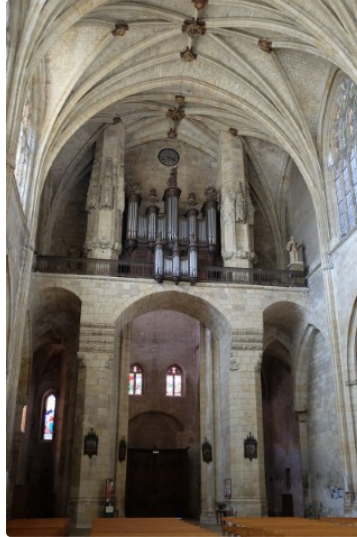
Route des orgues : Terraube, Lectoure, Condom