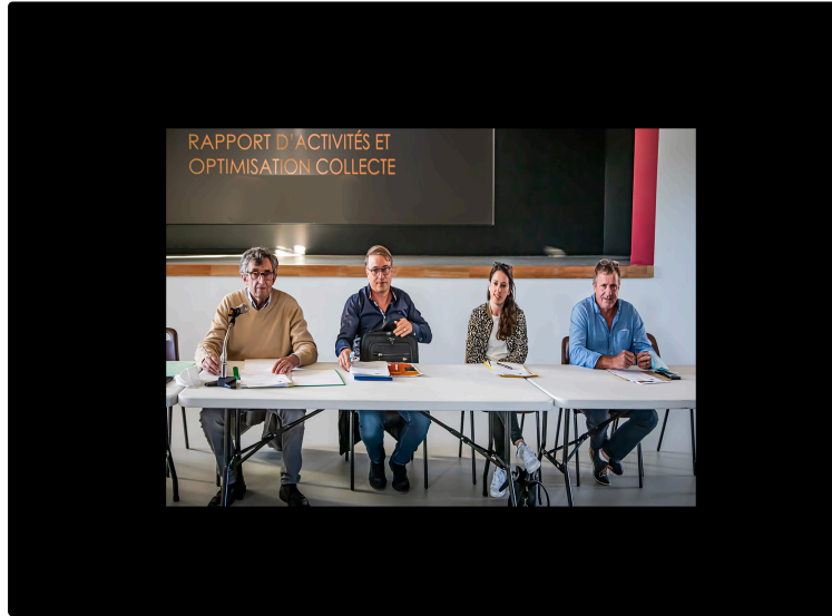
Secousses sur le Sictom Ouest en assemblée à Barcelonne-du-Gers (mis à jour le 18.10.2021)