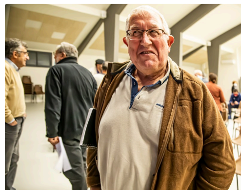
Cédric Berdoulet, maire de Barcelonne-du-Gers