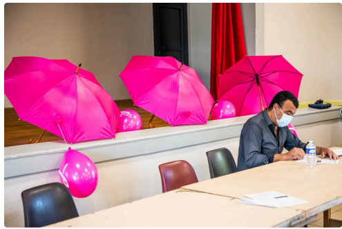
Parapluies et ballons roses pour Octobre rose