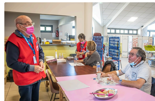
Donneurs et bénévoles