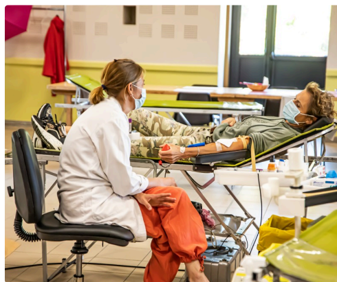
Donneuse de sang