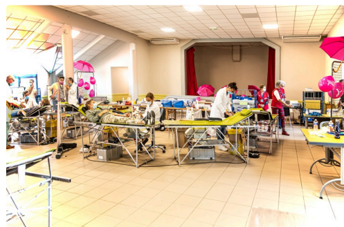
Vue générale de la salle de collecte de sang à Caupenne-d'Armagnac

La présidente de DSNA tient à remercier le personnel soignant de l'EFS, les bénévoles de DSNA, le maire de Caupenne-d'Armagnac et ses adjoints, les employés municipaux présents dès le matin à 8 heures pour l'accueil et le soir à 19 heures pour ranger.