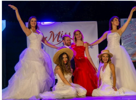
Miss Élégance Gers Bigorre 2021 sera élue à Vic-Fezensac ce week-end !

Vic-Fezensac accueille l'élection de Miss Elegance Gers Bigorre 2021 qualificative pour Miss Elegance Midi-Pyrénées 2021 samedi 16 octobre à 21 h salle polyvalente.