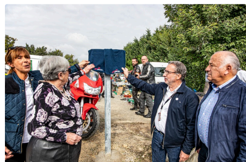
Dévoilement de la plaque de l'avenue André Diviès