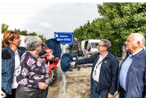
La plaque dévoilée