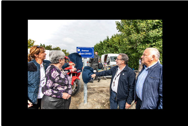
André Diviès a sa rue à son nom à Nogaro de son vivant

Dimanche 10 octobre, pendant que les belles à quatre roues entrent au circuit pour le Classic Festival, une manifestation d'un autre genre se déroule à côté de l'entrée. L'avenue qui part de l'entrée du circuit et va jusqu'à la route Nogaro – Caupenne-d'Armagnac va être baptisée « avenue André Diviès ». C'est-à-dire du nom de celui qui a lancé en 1971 le circuit, créé en 1959 par Robert Castagnon et Paul Armagnac. Et depuis lors, André Diviès en a été l'âme.