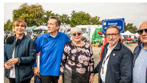
Après le dévoilement