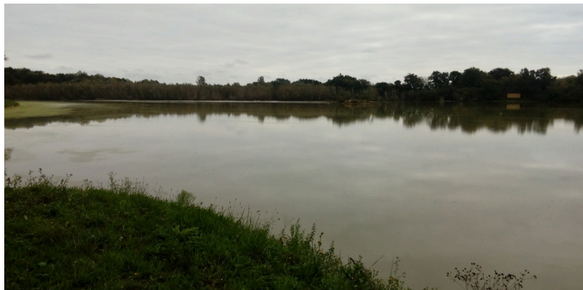
Photo- titre : L'ancien déversoir du XIX éme au pied d'une "ripisylve"( boisement des berges)