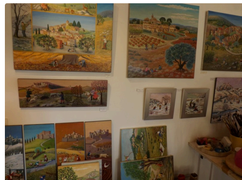
Des couleurs et du noir et blanc, du figuratif et de l'imaginaire