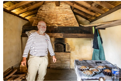
Le boulanger a fait du pain dans le four du Houn