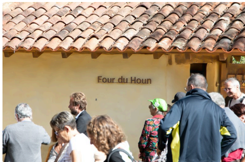
L'inscription Four du Houn est dévoilée