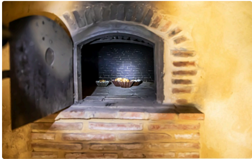
Intérieur du Four du Houn