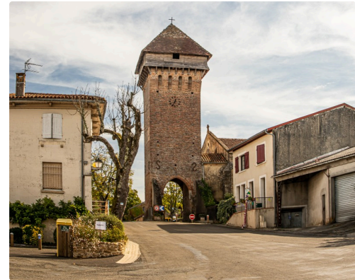
La porte de ville à Hontanx