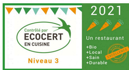
Diplôme Ecocert de niveau 3 pour la cantine scolaire