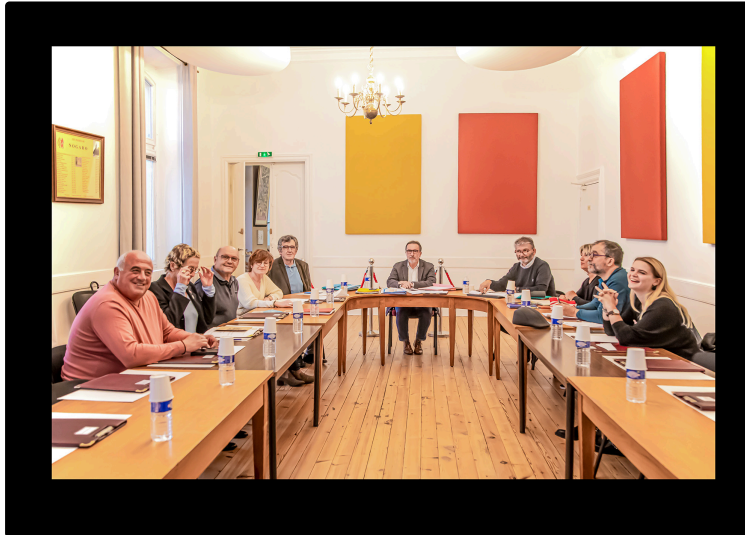
Rejet du projet de bassin nordique: déception et colère à Nogaro

Au conseil municipal, vidéosurveillance, éclairage par leds, label Ecocert etc.