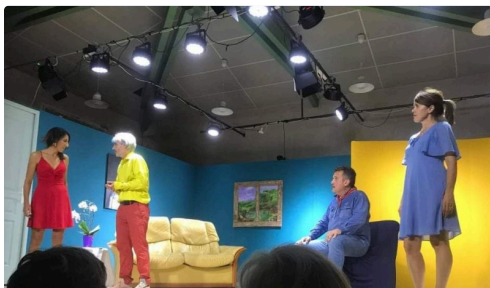
czerniak trie 4.JPG