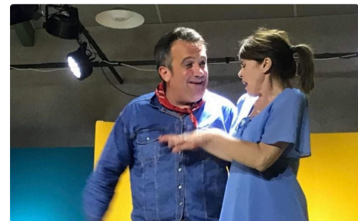
czerniak trie 1.JPG