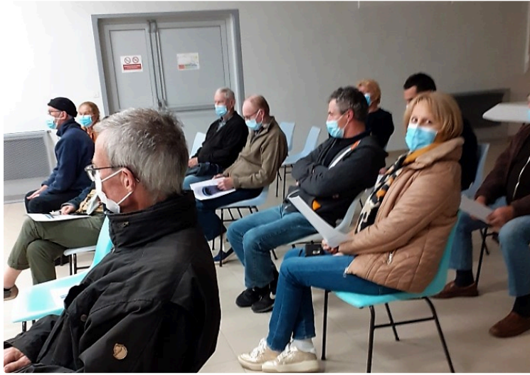
Un défibrillateur a été installé

Une réunion d'informations sur la mise en place du défibrillateur automatique externe (DAE) a été organisée au foyer de Saint-Pierre-d'Aubézies, le 4 octobre dernier.