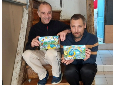
Croche-Patte, l'escargot intrépide aux idées de génie est de retour dans de nouvelles aventures !