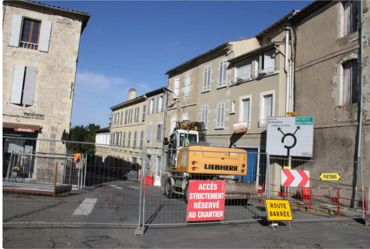
Quelques complications en vue pour la circulation au centre ville

Prévues à compter de ce lundi 4 octobre, c'est parti pour quatre semaines de perturbation