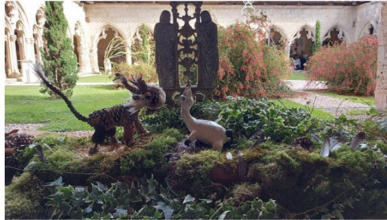
Eclosions magiques dans le cloître de La Romieu samedi !