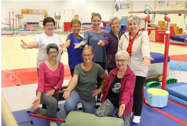
En partance pour la Crète et pour une semaine gymnique, touristique et conviviale

Les Condoises de la Municipale gymnique vont rejoindre au Golden Age des participantes de toute l'Europe