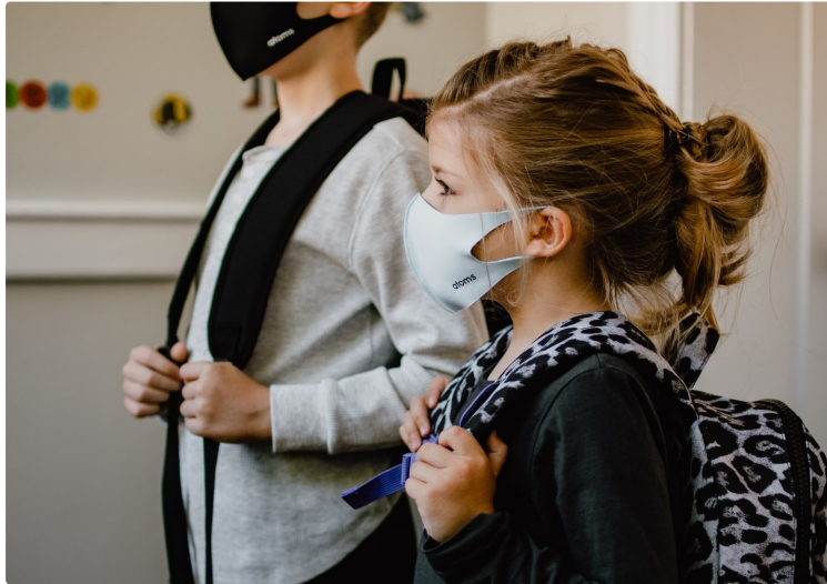
Occitanie. Covid-19. Abandon du port du masque à l'école primaire pour cinq départements dès lundi

Les départements ayant un taux d'incidence inférieur à 50 sont exemptés du port du masque à l'école. Les syndicats sont réticents.