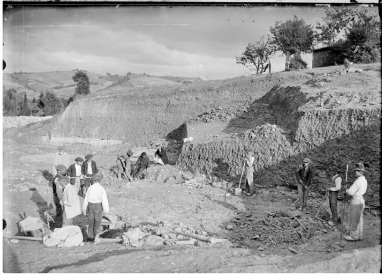
Conférence aux Archives départementales du Gers

« Edouard Lartet, de la révolution du singe à l'homme de cro-magnon » Jeudi 30 septembre 2021 de 18h à 19h30