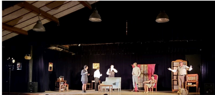
"Le repas des fauves", une soirée qui ne manquait pas de mordant!

L'association In § Off ouvrait sa saison vicoise salle polyvalente samedi soir avec une pièce de Vahé Katcha Le repas des fauves interprété par 8 acteurs de la troupe "Les pieds dans le plat" de Tarbes.