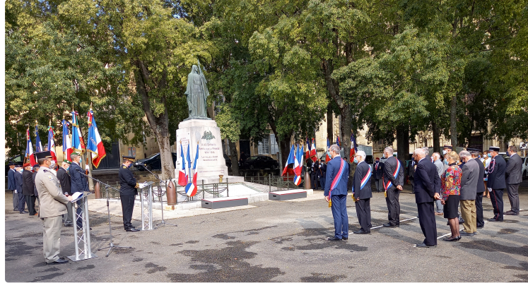
Pour surtout ne pas les oublier