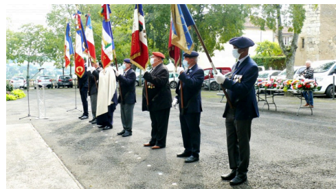
et autres porte-drapeaux.