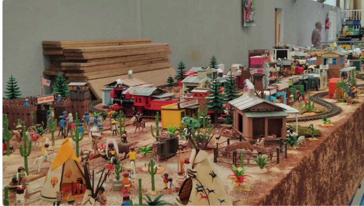
Qui sortira vainqueur de la bataille : Lego ou Playmobil ?