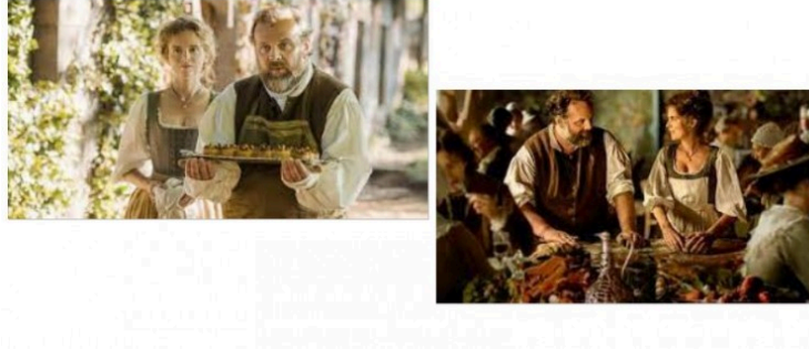
"Délicieux", l'histoire du premier restaurant au cinéma samedi soir

Si vous ne l'avez pas vu lors de sa sortie nationale, Cine Qua Non vous propose samedi à 21 h le film Délicieux de Eric Besnard avec Grégory Gadebois, Isabelle Carré et Benjamin Lavernhe