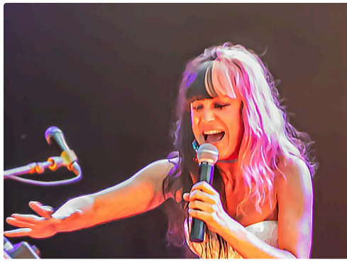
3 Frederika 1bis 230921.jpg