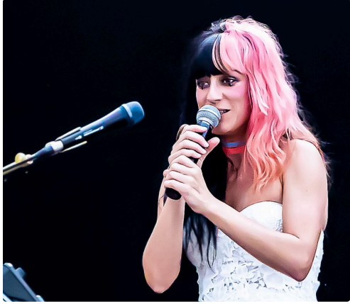
8 Frederika 1bis 230921.jpg