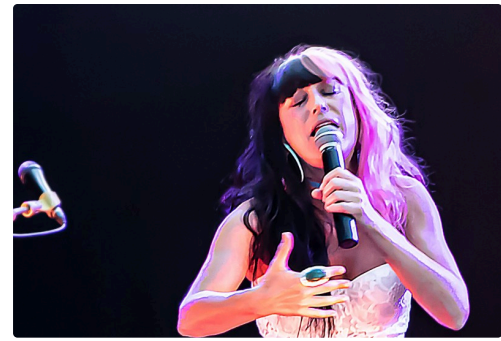
5 Frederika 1bis 230921.jpg