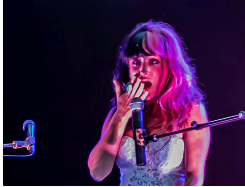
12 Frederika 1bis 230921.jpg