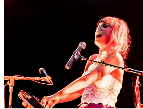
18 Frederika 1bis 230921.jpg