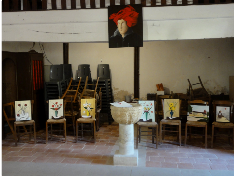
Notre-Dame-des-Vignerons ou Saint-Pierre-de-Lamothe ?

Peu importe, les nombreux visiteurs ont bien su la trouver lors des récentes Journées du Patrimoine