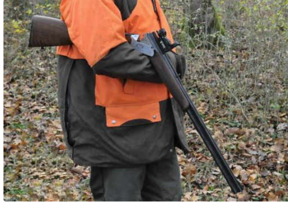
Du bon comportement du chasseur

Le président de la société locale rappelle les bons usages