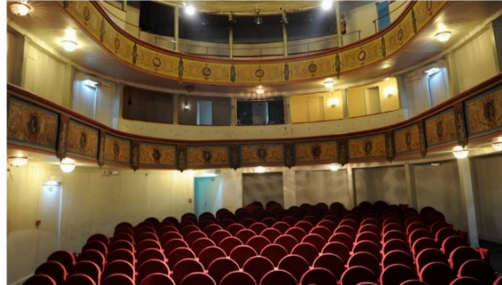
Au théâtre ce soir avec l'association In § Off samedi !

Vous aviez peut-être assisté en septembre dernier à la première représentation proposée par l'association vicoise In § Off, Recherche pigeon désespérément.