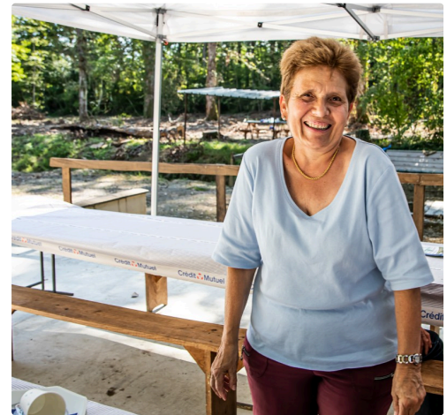
La dame qui a (très bien) servi le repas