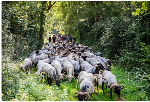
Gros plan sur l'arrivée du troupeau