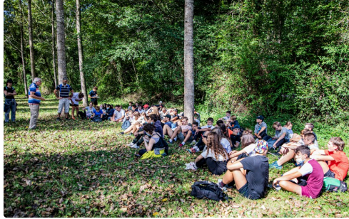
Les lycéens sont en place