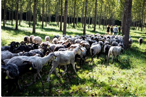
Arrivée du troupeau vus de l'arrière