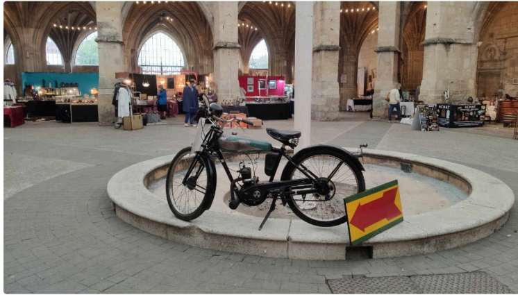
Antiquités et brocante : suivez la flèche... vous y êtes !

Dernier jour pour en profiter cette année à Condom