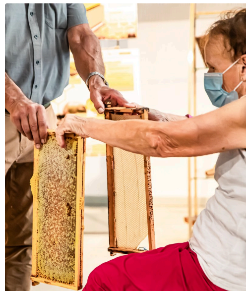
Cadre vierge et cadre rempli par les abeilles

Il est encore temps de s'inscrire (au 05 62 09 18 11). Participation : 4 euros (enfant : 2 euros). Ce prix inclut la visite libre du Musée du Paysan gascon et de toutes ses collections.