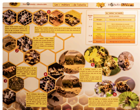
Panneau des métiers de l'abeille