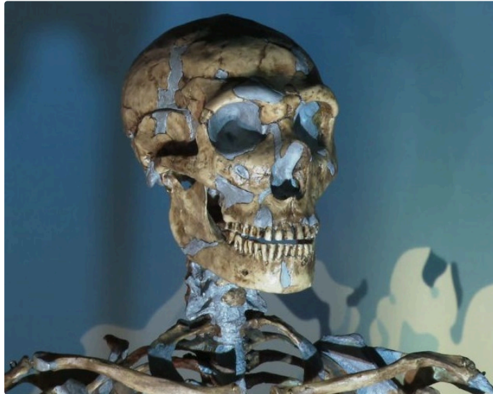
Emission exceptionnelle dimanche à 10h 45 sur France 3 Occitanie.