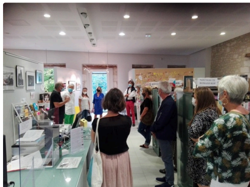
Lors du vernissage