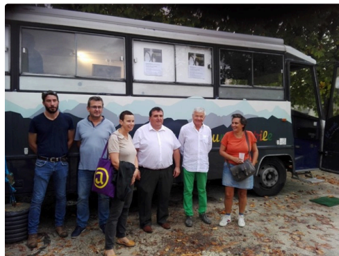
Près du bus