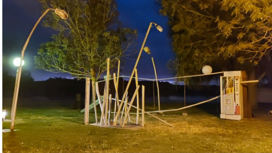
Un spectacle à ne rater sous aucun prétexte, "Allant vers" de la compagnie Kiroul !

Si vous ne devez voir qu'un spectacle du festival N'amasse pas mousse - sans préjuger en rien de la qualité des autres spectacles proposés-, c'est la dernière création de la compagnie Kiroul, Allant vers qui termine à Castéra Verduzan, sur ses terres, une tournée estivale.