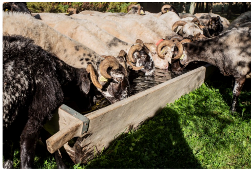
Les brebis à l'abreuvoir