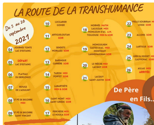
Programme de passage du troupeau