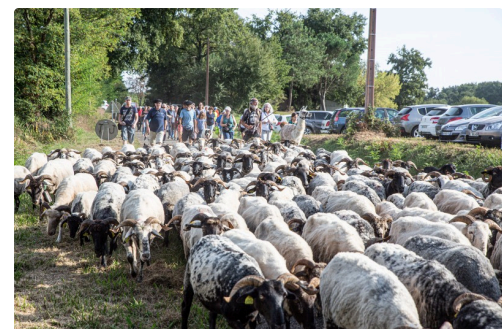
La marée moutonnaire en septembre 2019