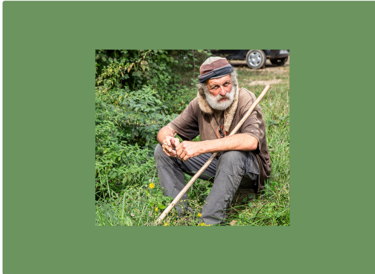
Passage de «la Transhumance» à Perchède et Toujouse