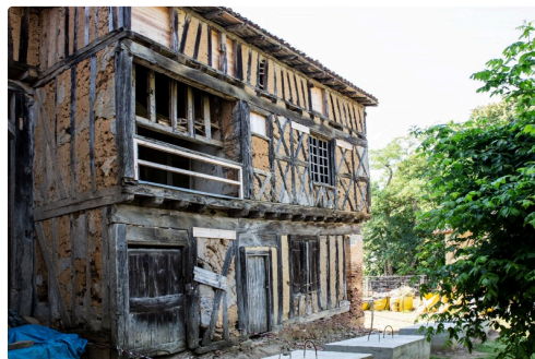
Façade du Castet côté Manse