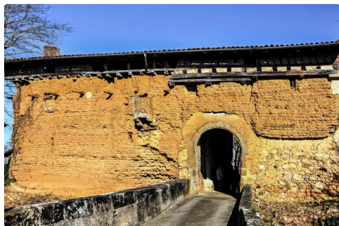
Le Castet avec son pont

N.B. - Sur la photo du haut de page : l'espace entre la Manse (à droite) et le Castet, à gauche.