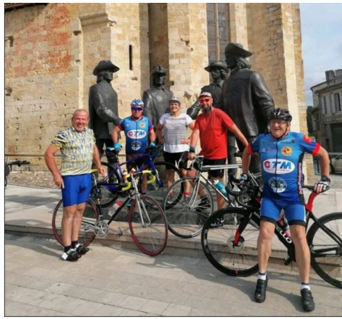
en balade a condom.JPG