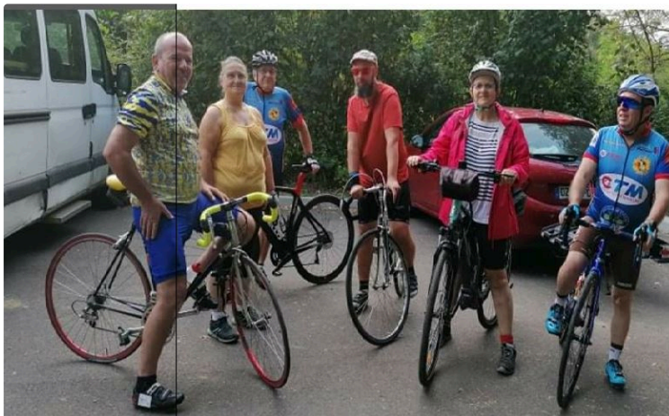
Tout en douceur, chacun son rythme