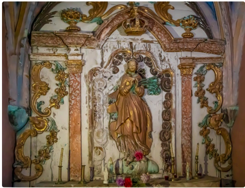
La Sainte-Vierge de l'Annonciation