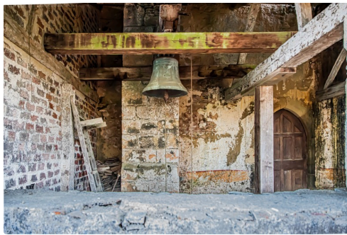
La cloche remplacée à l'entrée