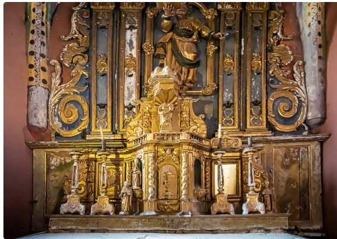
Retable du maître-autel avec Saint-Pierre