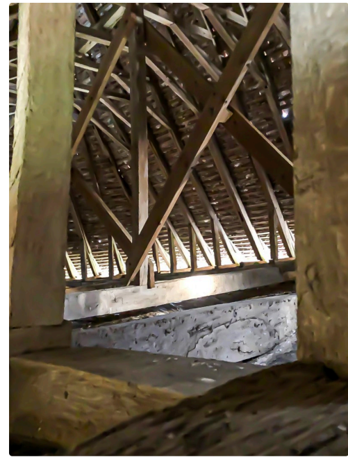
La belle charpente