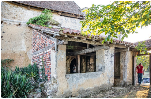
Accès à l'église par l'emban