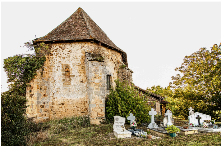
L'église de Mauriet vue depuis le cimetière

D'après l'ouvrage de La Société historique et archéologique du Gers "Les Communes du Gers tome II", l'église de Mauriet est la plus remarquable des trois églises de saint-Martin-d'Armagnac. Dédicée à Saint-Pierre-aux-liens (qui figure dans le retable, voir photo), elle est de style gothique avec un chevet (2) à cinq pans. Le clocher s'est écroulé en 1971, mais la cloche datant de 1727 a été miraculeusement préservée et a été remplacée à l'entrée de l'église.