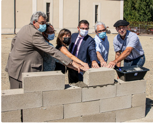
Tous unis sur la 1e pierre