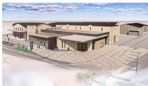
Vue d'ensemble du groupe de bâtiments