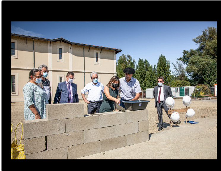
Le chai ambitieux de Plaimont a eu sa 1ere pierre à Saint-Mont

Toutes les bonnes fées se sont penchées sur elle !