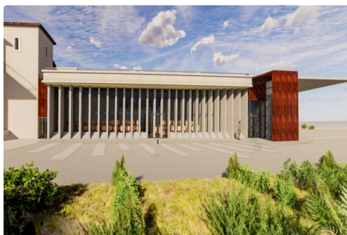
Gros plan sur le futur chai