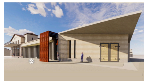
Le chai du côté réception de la vendange (document communiqué par Plaimont)