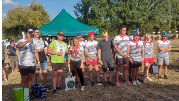
Des concours et des récompenses à Gascogn'agri

Qui dit foire agricole dit concours divers et variés, concours de vaches grasses, concours départemental de la race blonde d'Aquitaine, concours départemental et régional de labour mais aussi concours des pratiques agro-écologiques prairies et parcours.