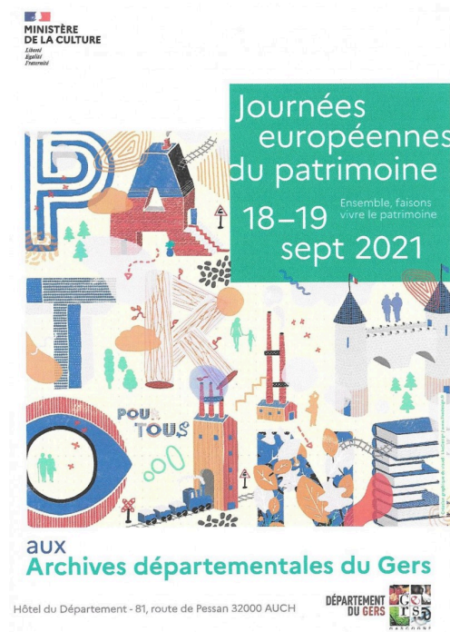
Affiche Journées du Patrimoine.jpg

Réponse : C'est notre ambition ! Les Archives départementales représentent le lieu de mémoire par excellence du cœur de Gascogne, mais ni le lieu qui les renferme, ni cette mémoire ne sont figés ! Le bâtiment dont nous avons la responsabilité au sein du parc de l'hôtel du Département doit être vivant et perçu comme l'un des lieux de vie culturelle et éducative majeurs du Gers. On doit aussi faire vivre les Archives départementales hors de leurs murs, sur le terrain ! C'est notre rôle de créer des vocations et de relancer la recherche universitaire. Nous avons à cet égard proposé au Département de créer une bourse spécifique qui sera offerte à un étudiant de master ou de doctorat qui valorisera les ressources documentaires conservées à Auch. Nous travaillons aussi main dans la main avec la Société archéologique du Gers. Par ailleurs, notre atelier de restauration et de reliure est l'un des mieux dotés de la région : il est riche d'un niveau d'expertise reconnu au niveau national et d'un savoir-faire d'excellence. C'est très précieux pour un service comme le nôtre. J'invite tout le monde à suivre les actions qui sont menées aux Archives départementales sur le site www.archives32.fr ainsi que, désormais, sur les réseaux sociaux (Facebook et Twitter) !