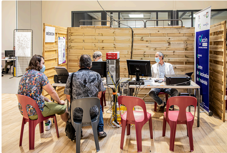
La vaccination à Nogaro s'accélère

Le nombre d'injections est multiplié par 3