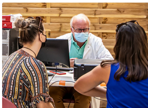
La consultation médicale