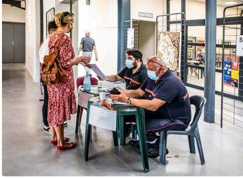
9 Dernier check point avant la sortie 1bis 010921.jpg