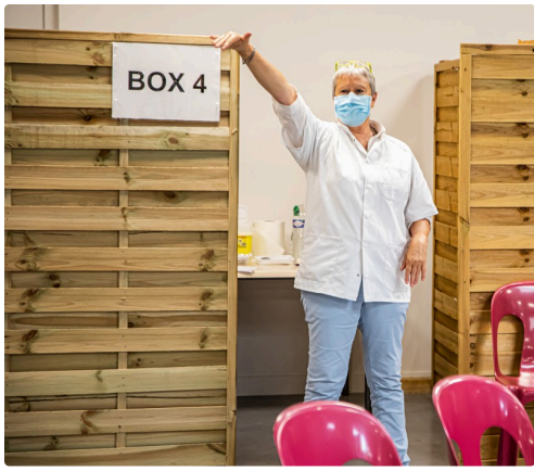
Une infirmière appelle un candidat au vaccin