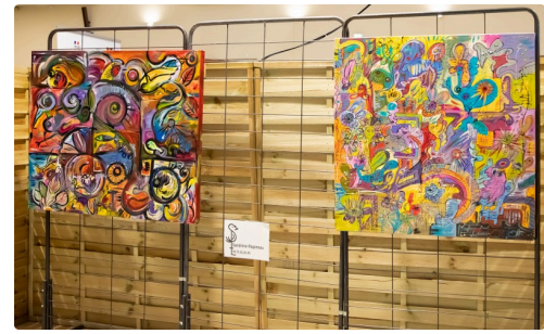
Toujours de superbes tableaux exposés