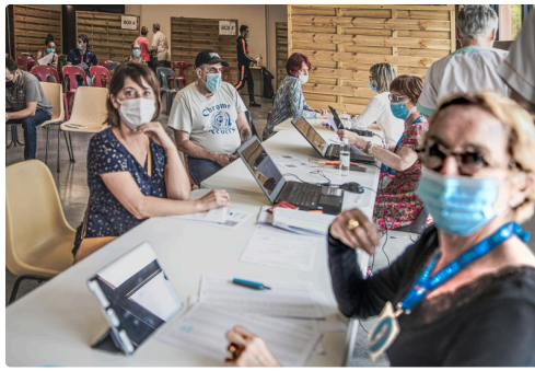
Enregistrement des vaccinés et remise du QR code