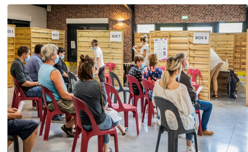
En attente du vaccin