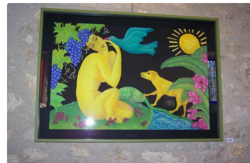
cecile de bruijn et maia alonso à sarrant 002.JPG