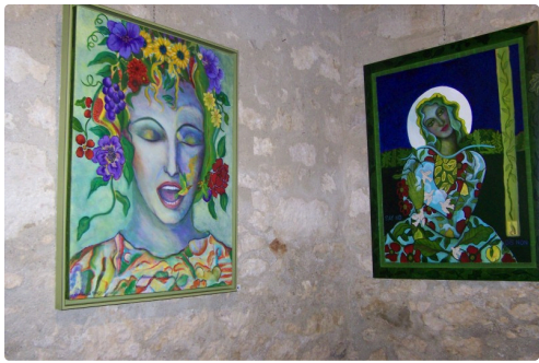
cecile de bruijn et maia alonso à sarrant 001.JPG