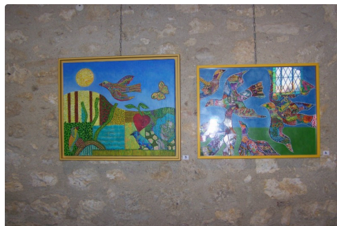
cecile de bruijn et maia alonso à sarrant 003.JPG