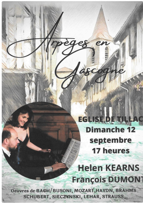
Arpege en Gascogne 12092021.jpg